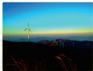
《西湾风电》 快鹿公司 金晖