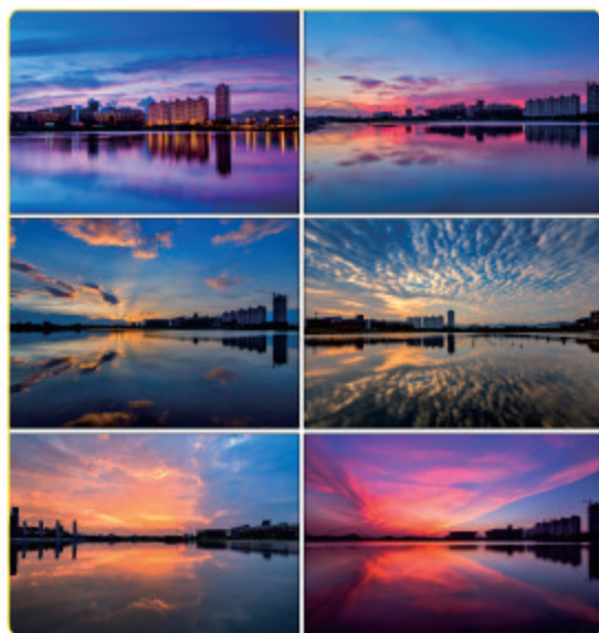
《多彩灵溪湖》 温州矾矿 陈萍