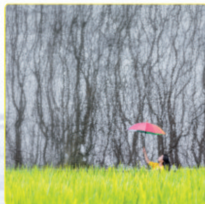
《筑梦》 温州矾矿 陈萍