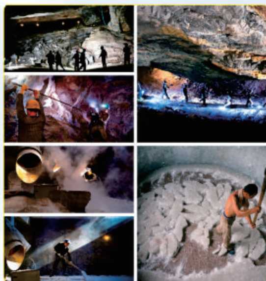
《劳动创造美组照》 温州矾矿 朱良扬