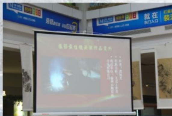
《无名工作者》（反映今日家居人生产劳动操作的场景）获最佳镜头奖