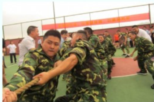
工业集团代表队在拔河比赛中奋力拼搏

9月25日晚，国企辩论赛开赛，初赛围绕“网络使人更亲近还是更疏远”这一辩题，正反双方唇枪舌战，轮番上阵，尽展企业职工风采，工业集团代表队作为正方，在“网络使人更亲近”的辩论中拔得头筹，顺利晋级获得优秀组织奖。