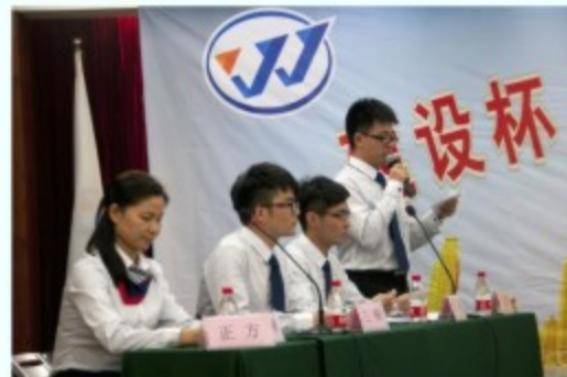
工业集团辩手攻辩正酣

9月25日晚，国企辩论赛开赛，初赛围绕“网络使人更亲近还是更疏远”这一辩题，正反双方唇枪舌战，轮番上阵，尽展企业职工风采，工业集团代表队作为正方，在“网络使人更亲近”的辩论中拔得头筹，顺利晋级获得优秀组织奖。