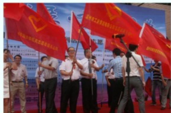
工业集团参加志愿者授旗仪式

以“赶超发展·实干圆梦”为主题的全市国资国企文化月活动从9月启动，先后举办了企业文化培训、书画风采展示、职工风采展等活动，至10月下旬闭幕，工业集团组队积极参加各项活动，充分展现集团良好的精神风貌，取得较好的成绩，拔河赛、乒乓球和职工服装秀比赛均获得三等奖，辩论赛获得优秀组织奖，组织承办的“工投杯”书画美术摄影展和工艺美术大师精品展，在全市国资国企系统赢得了较好反响，荣获“特别贡献奖”，其中有20余位干部职工获得书画美术摄影展各类奖项。