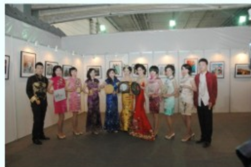
职工服装风采秀光彩夺目

9月25日，在力与力的较量下，工业集团代表队在企业职工拔河比赛中，斗志昂扬，众志成城，顺利从小组赛中脱颖而出，最终荣获第三名。