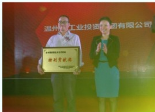
工业集团在此次文化月活动中荣获“特别贡献奖”

以“赶超发展·实干圆梦”为主题的全市国资国企文化月活动从9月启动，先后举办了企业文化培训、书画风采展示、职工风采展等活动，至10月下旬闭幕，工业集团组队积极参加各项活动，充分展现集团良好的精神风貌，取得较好的成绩，拔河赛、乒乓球和职工服装秀比赛均获得三等奖，辩论赛获得优秀组织奖，组织承办的“工投杯”书画美术摄影展和工艺美术大师精品展，在全市国资国企系统赢得了较好反响，荣获“特别贡献奖”，其中有20余位干部职工获得书画美术摄影展各类奖项。