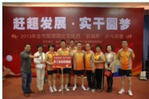
工业集团代表队在乒乓球团体赛中获得第三名

在10月23日举行的“职工服装风采秀”活动中，工业集团风采秀选手，旗袍妆扮，秀场中以展现传统工艺美术作品为亮点，博得了现场观众的阵阵掌声，最终获得服装风采秀比赛的季军。