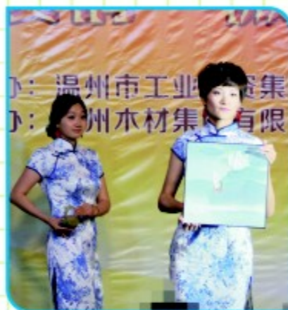
创意园公司、营运公司联合表演《工艺美术产品展示秀》