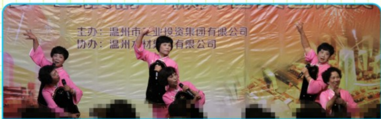
矾矿老职工表演戏曲联唱