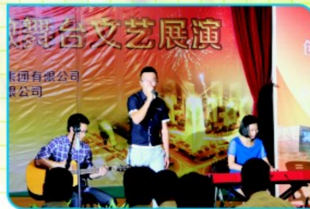
新能源公司 音乐组合《大中国》