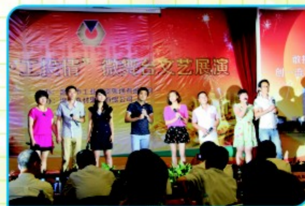
医药集团表演小组唱《相亲相爱的一家人》