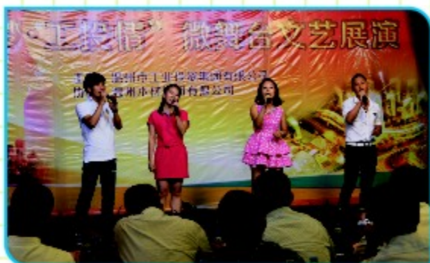
木材集团公司表演小组唱《爱因为在心中》