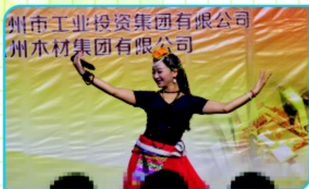
鹿鹿集团表演歌舞《卓玛》