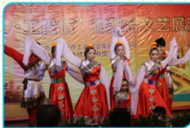
陶瓷品市场集体舞蹈《高原红》