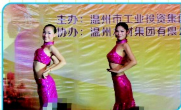
矾矿表演双人舞《喜水》