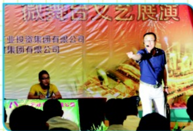
冶炼公司表演小品《应聘》