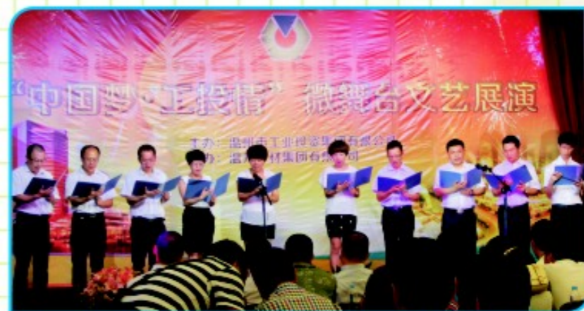
集团总部党员代表表演合唱《工业集团之歌》