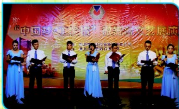
国际家居公司诗朗诵《我的中国梦》

编者按：6月29日，工业集团开展“中国梦·工投情”微舞台文艺展演活动。此次文艺展演共有10家单位11个节目参与。微舞台内容鲜活、形式新颖、吸引力强、文明健康，借助这一新的载体，改善了工作方式，活跃了员工思维，丰富了员工生活，增强了员工创新能力。舞台节目蕴含了各自的梦想，舞台展现了党员风采，凝聚了党心人心，激发了集团系统上下干事创业的信心和决心。