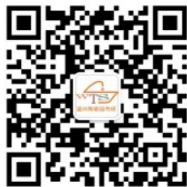
温州陶瓷品市场微信二维码

国际家居公司通过坚持不懈地加强企业文化建设，企业的凝聚力、激励力、约束力、导向力和辐射力大大增强，对企业今后的脱困、发展、生产经营和改造提升工作起到了强有力的保证和促进作用，为“幸福工投”建设做出更大的贡献。