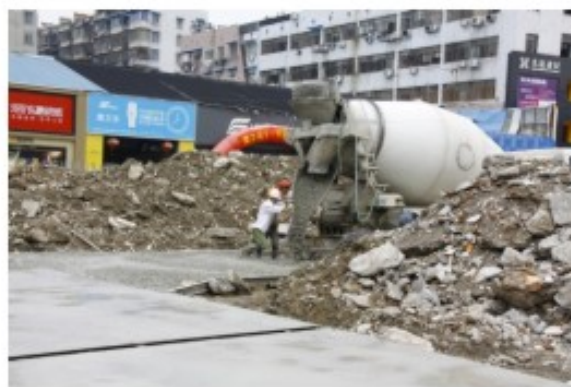
填平、浇注工地各处出入通道，以全力速度加快推进工程开工各项前期工作