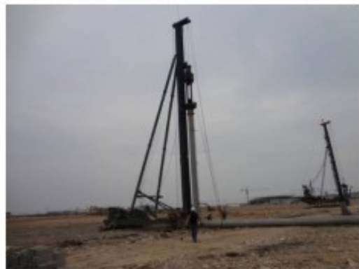
I标第一根预应力管桩桩基试桩

两个施工单位的负责人均表态：虽然丁山这里的施工条件较差，但施工单位通过精心组织施工、合理调配人员和机械，确保工程施工质量和进度。截止到4月底，项目已累计完成投资额为16600万元，项目的各项工作都按计划有序地进行，项目的建设进程又迈出了坚实的一步，为实现2014年12月项目整体竣工及牛山国际城市综合体和市域铁路S1线的建设奠定基础。