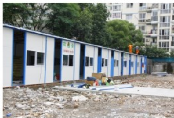
建设施工单位用房已经搭建完工

温州国际家居（陶瓷品市场）有关负责人表示，在温州陶瓷品市场一期改建提升工程进入倒计时之际，将继续加强组织领导、高度重视和健全各项工作机制，全心全意做好市场改建工程建设的前期审批、办理、协调、配合等系列工作，确保整个工程早日开工建设。