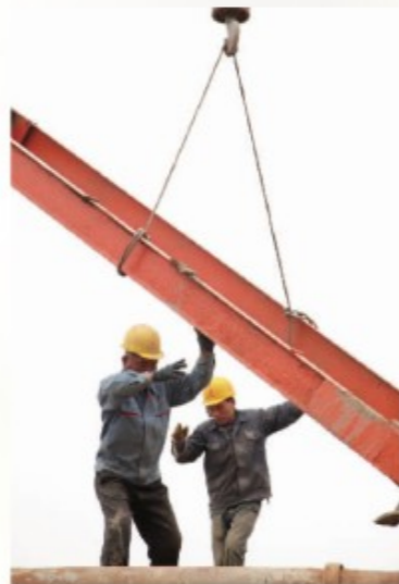
滨江广场一期工地，工人在施工中

据媒体报道，我市首个城市综合体项目——温州万达广场，总建筑面积38.71万平方米，其中纯商业面积28万平方米，是目前温州市区百货商场总面积的2倍多。来自温州木材集团的数据显示：滨江广场项目总占地506亩，总建筑面积103万平方米，其中住宅50万平方米，商业53万平方米。以此计算，未来滨江广场的面积相当于3个万达广场。