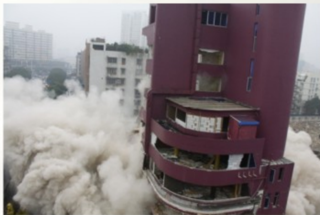
主楼东首8层高度的楼层在当天上午顺利拆除

据悉，接下来几天，施工人员将对现场进行建筑垃圾清理、清运，争取尽快腾空该地块，为温州陶瓷品市场一期建设工程早日开工奠定了基础。