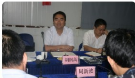
胡副市长作重要指示

胡副市长一边仔细听取集团的各项工作汇报，一边不时地就相关问题进行提问咨询，如温化生活区的改造事宜。胡副市长在听取集团工作汇报后，对集团工作所取得的成绩和正在推进的各项工作给予充分肯定，同时指出，工业集团企业和员工多，涉及行业多，事多事杂，各项问题需要逐项解决，集团发展重要，注重稳定同样也重要，集团的一些工作仍需再做深、做细一些。