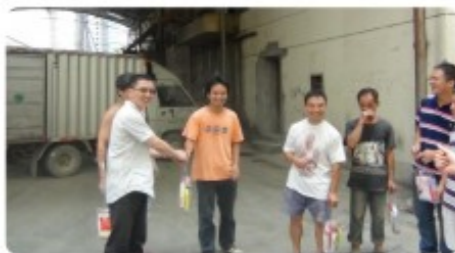
总工程师於其一在面粉公司发放慰问品

进行了详细的检查。检查组针对各项工作制度的建立、存在的问题以及安全事故隐患等方面提出了意见。