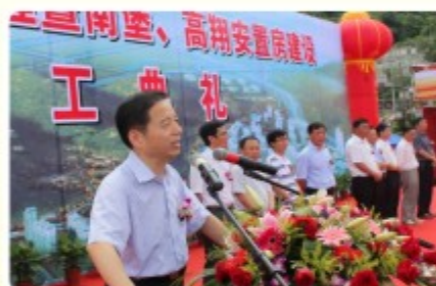
陈书记发布开工令

“有了金山银山,更要有蓝天白云、青山绿水。只有这样,才能实现生产生活生态‘三生融合’,才能创造老百姓的幸福生活。”昨天,省委常委、市委书记陈德荣督查牛山公园建设时如是强调。