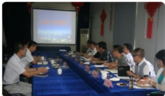
集团领导作工作汇报