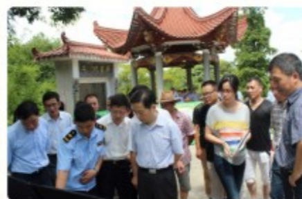
陈书记听取牛山公园建设情况汇报