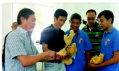
周董一行探班薪传营