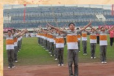
机电技师学院代表队