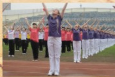
木材集团公司代表队

最后，温州木材集团公司代表队和温州机电技师学院代表队分别荣获了金奖、银奖，比赛在雄壮的歌声中圆满结束。