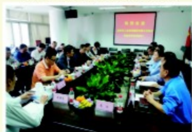
考察团与厦门顺承资产管理有限公司进行座谈

“七大破难攻坚大行动”，深化工投系统国有集体企业改革，特别是对100家老国有集体企业，采取改制注销、资产开发、规范管理三类方式，分门别类、因地制宜，稳妥推进。