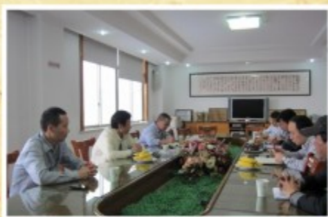
在快鹿集团召开专题协调