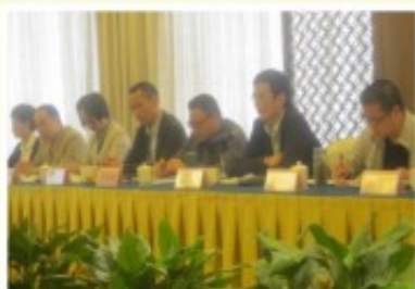
考察团与宁波工投进行座谈交流