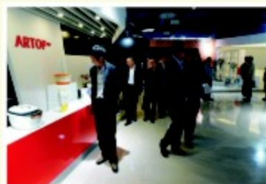
在宁波工投和丰创意广场展厅考察