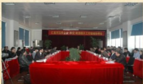
汇昌河沿岸企业（单位）改造提升工作协调会现场