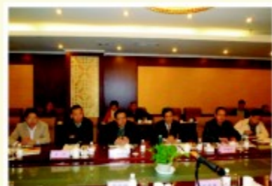
考察团在青岛华通集团座谈考察